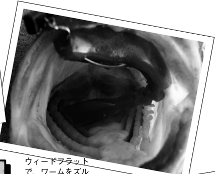
ワイドフラット上で、ワームをズルズルと平行移動。そんなときのオヤビーなのです!