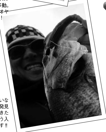
誰も気付いていないスポットを発見することができたら、それはもう入れ食い天国です!!