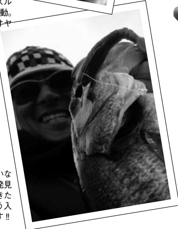
誰も気付いていないスポットを発見することができれば、それはもう入れ食い天国です!!